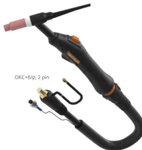
ОКС+6/p, 2 pin